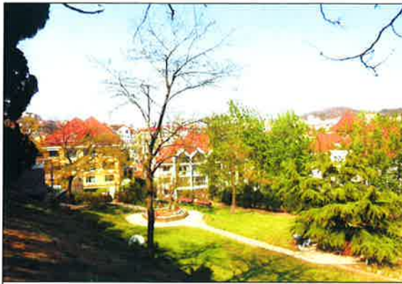
팔대관과 주변 건물

산책로를 걷다가 우리시도 어려운 여건속에서도 헌신적으로 일해준 작업인부들과 시민들의 동참속에 유달산에 아름다운 둘레길을 조성할수 있었던 것에 대해 감사하다는 생각이 들었다.