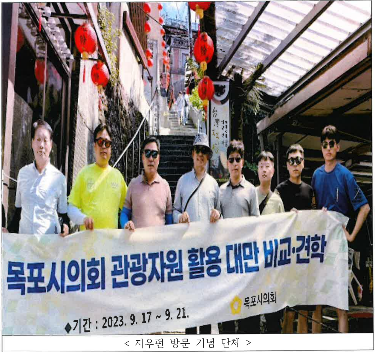
< 지우편 방문 기념 단체 >