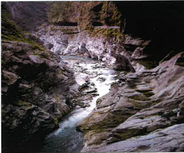
< 태로각협곡의 탁류 >