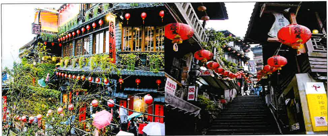
< 지우편은 계단과 홍등으로 특색있는 촬영지로 유명하다 >