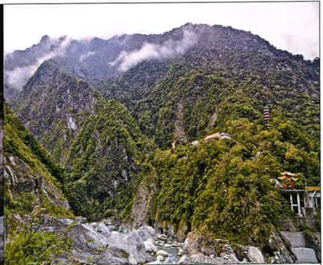
< 태로각협곡의 전경 >