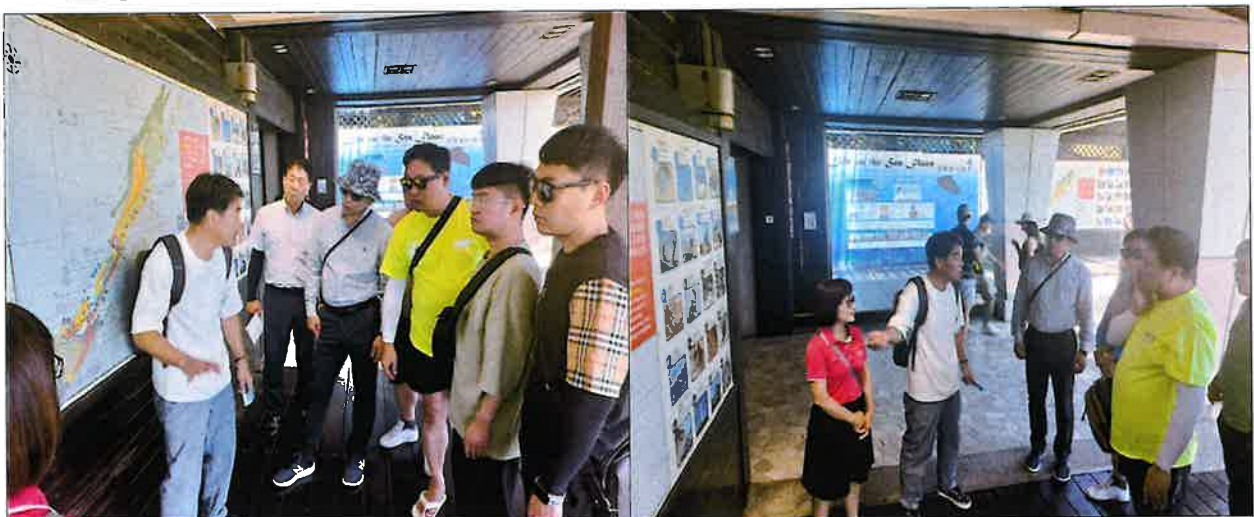
< 예류지질공원 형성 배경 설명을 듣고 있다 >