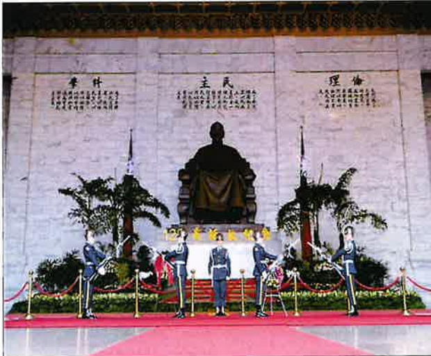
< 중정기념당 근위병 교대식 >