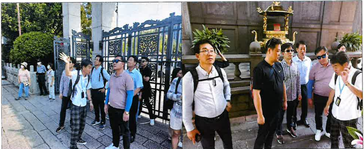
< 용산사 전경을 둘러보고 있다 >