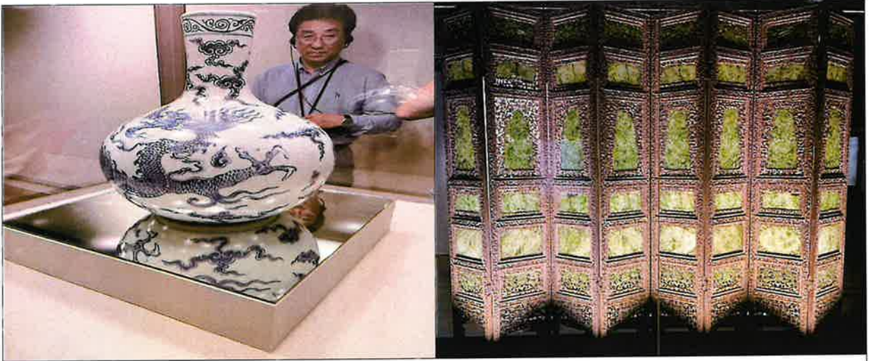
< 국립고궁박물관 전시품 관람 >