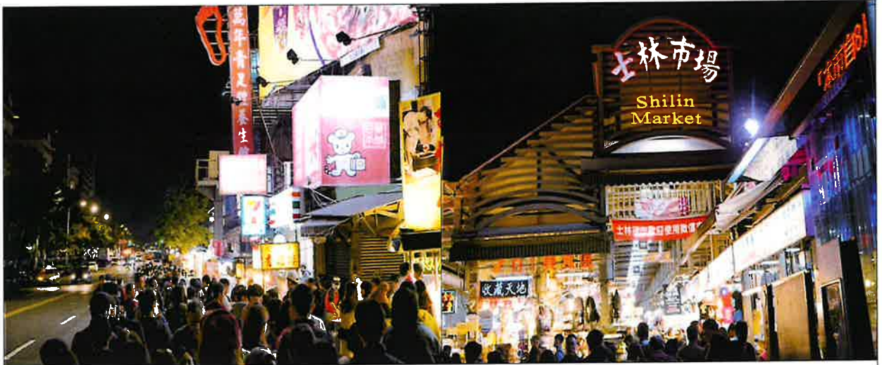
< 인파로 가득한 스린야시장 >