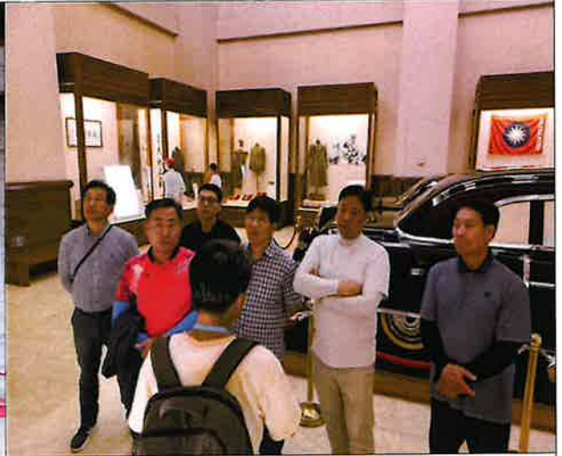
< 장제스의 생애 설명을 듣고 있다 >