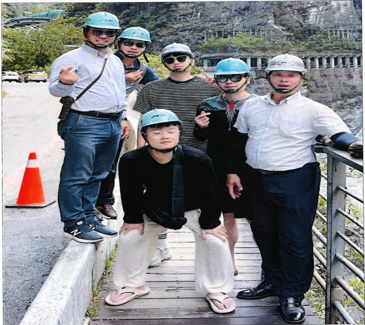
< 태로각협곡의 좁은 인도와 난간 >