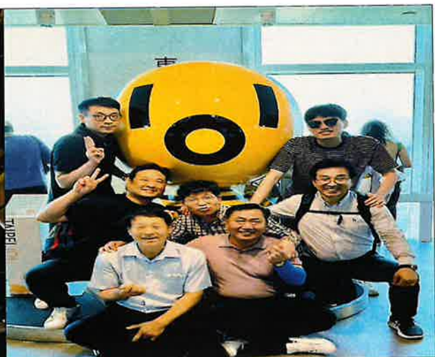
< 제진장치를 캐릭터화한 조형물 >