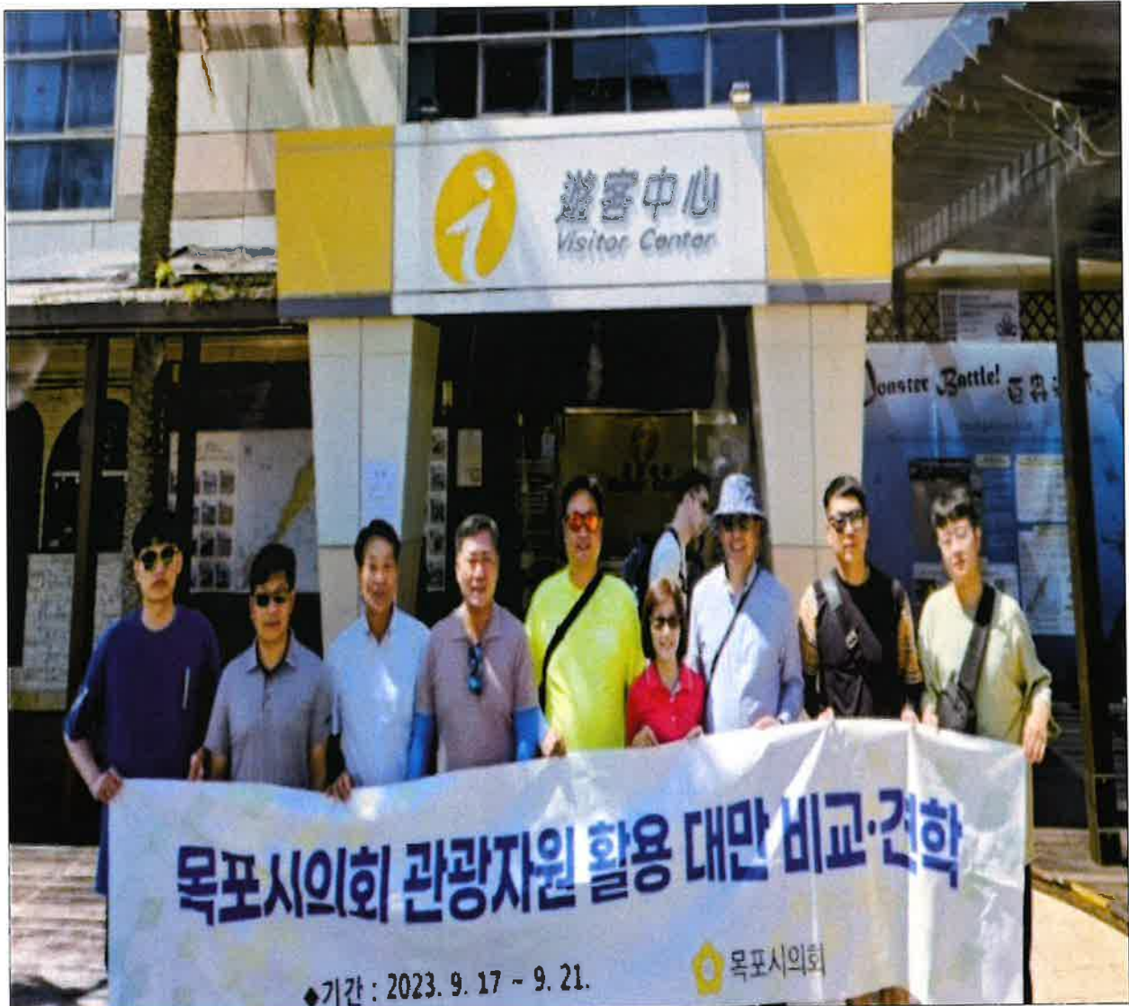
< 예류지질공원 방문 기념 단체 >