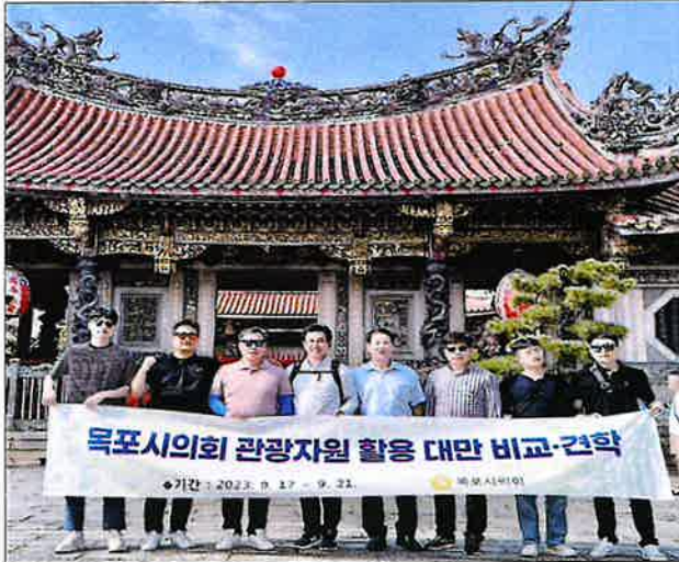
< 용산사 방문 기념 단체 >