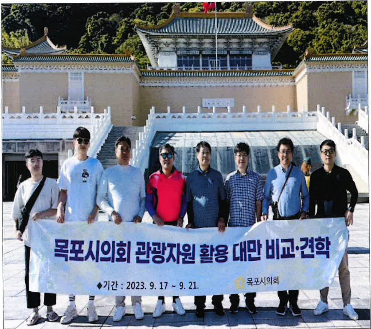
< 국립고궁박물관 방문 기념 단체 >