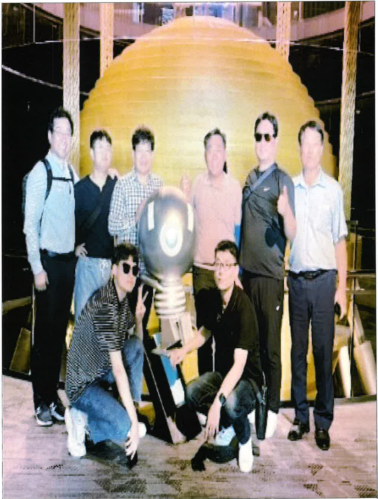
< 101타워 방문 기념 단체 >