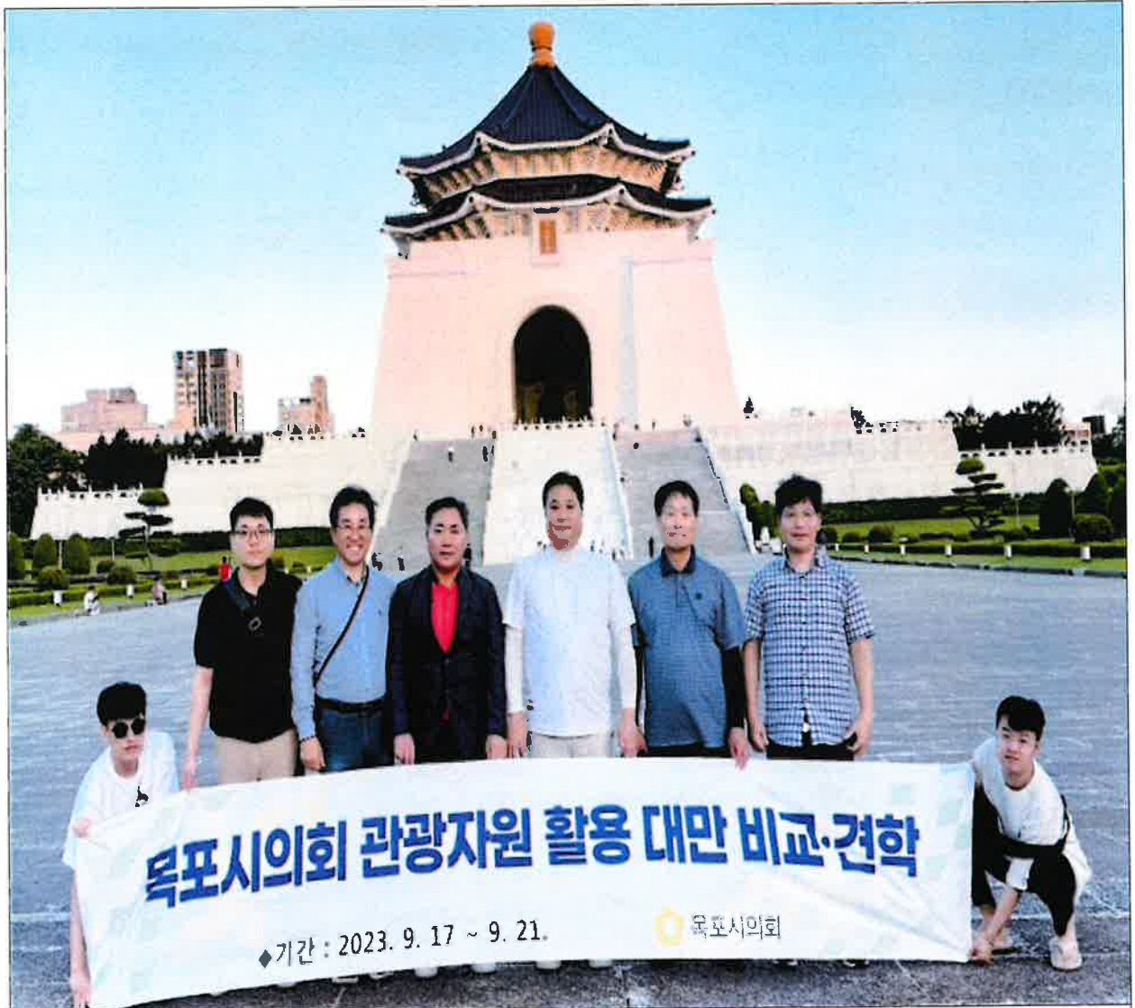
< 중정기념당 방문 기념 단체 >