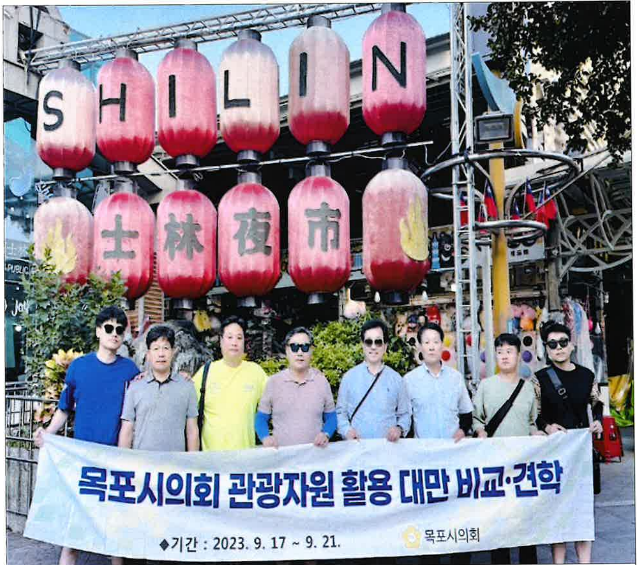
< 스린야시장 방문 기념 단체 >