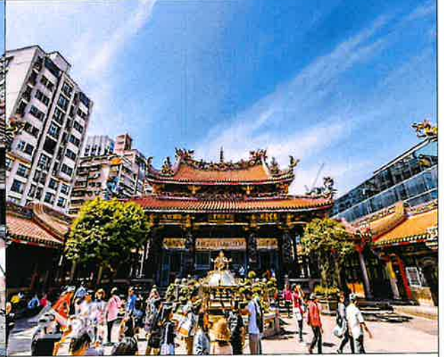
< 용산사 방문 참배객 행렬 >